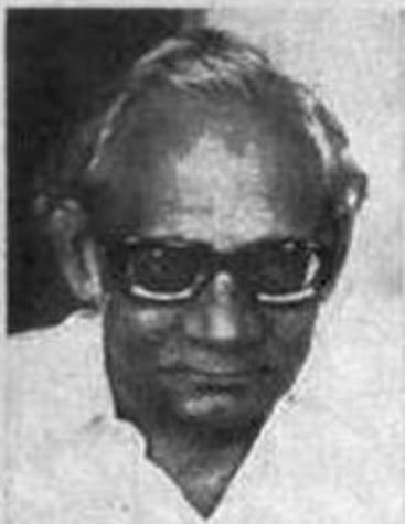
خواجہ احمد فاروقی (شخصیت اور ادبی خدمات)